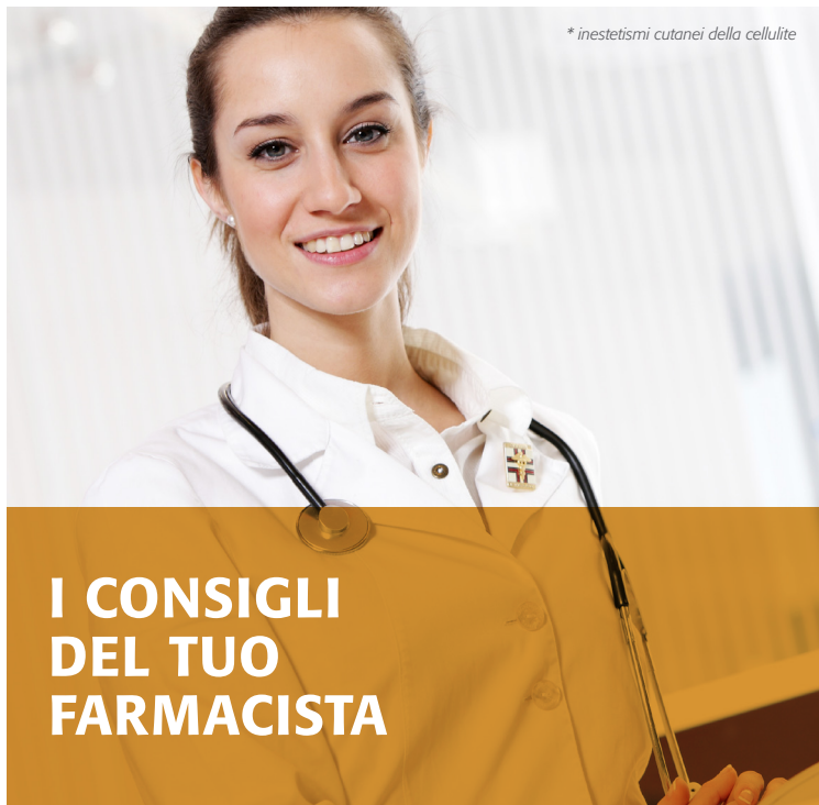
* inestetismi cutanei della cellulite

La cellulite* essendo una malattia va trattata come tale con appropriati rimedi farmacologici. La cellulite* si manifesta a livello cutaneo con una serie di tipici inestetismi (pelle a buccia d'arancia o a materasso). Gli inestetismi dovuti alla cellulite possono essere contrastati da pratiche estetiche, da trattamenti cosmetici e da specifici integratori alimentari. Ottimi coadiuvanti di questi trattamenti sono sicuramente l'esercizio fisico ed una dieta equilibrata. Utili per favorire le funzioni del microcircolo sono i bioflavonoidi e piante come la Centella e il Meliloto. Infine, sono sempre utili i massaggi, in particolare il linfodrenaggio che aiuta a smaltire i ristagni linfatici.